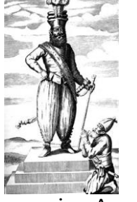
படம் - A