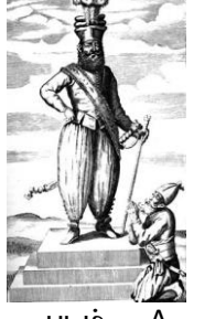
படம் - A