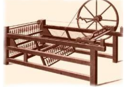
படம் - B