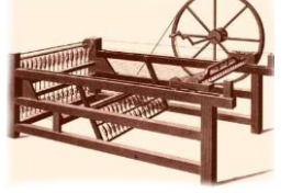
படம் - B